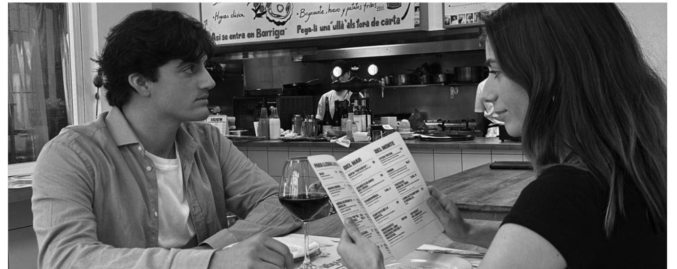
Protagonistas del spot “Castellón es otra cosa” en Barriga.

La ciudad responde con orgullo y personalidad, reivindicando autenticidad, gastronomía y un Mediterráneo sin masificaciones bajo el lema “Castellón es otra cosa” .